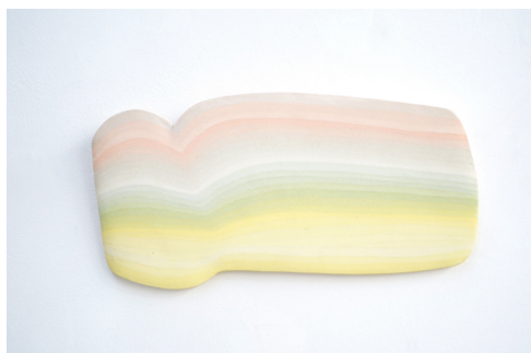
Sculpture murale « De l'espace entre les couleurs » Porcelaine | Terres colorées 15 | 30 | 1 cm

Karine Lacquemant, conservatrice des collections arts-appliqués, La Piscine Roubaix