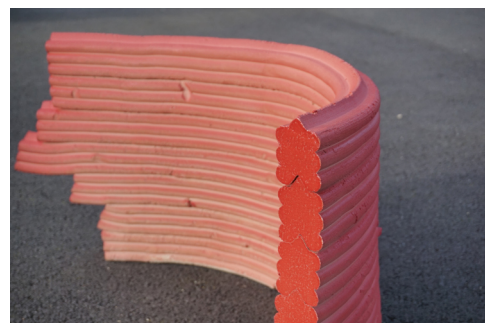
Sculpture « Left-over » Grès | Email 100 | 50 | 50 cm

POUR TOUTE DEMANDE DE VISUELS OU INFORMATIONS COMPLÉMENTAIRES