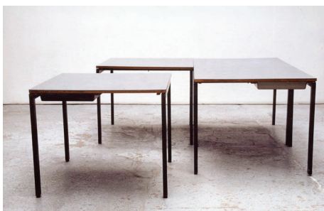
Le Corbusier / Charlotte Perriand Table carrée avec tiroirs, 1956-59

Tout au long de sa carrière, Charlotte Perriand s'est profondément attachée à maintenir une qualité de vie : des maisons ouvrières, citadines ou champêtres, aux refuges et hôtels de montagne, elle a sauvé l'homme et son environnement en créant un mobilier à la fois confortable et fonctionnel.