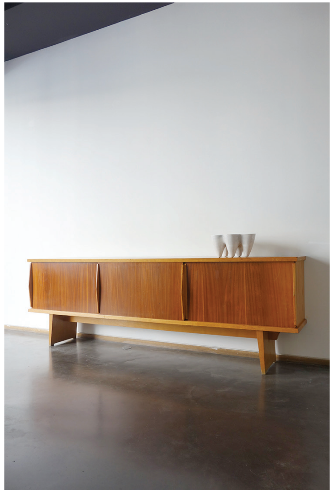
Charlotte Perriand / Pierre Jeanneret Bahut, circa 1947