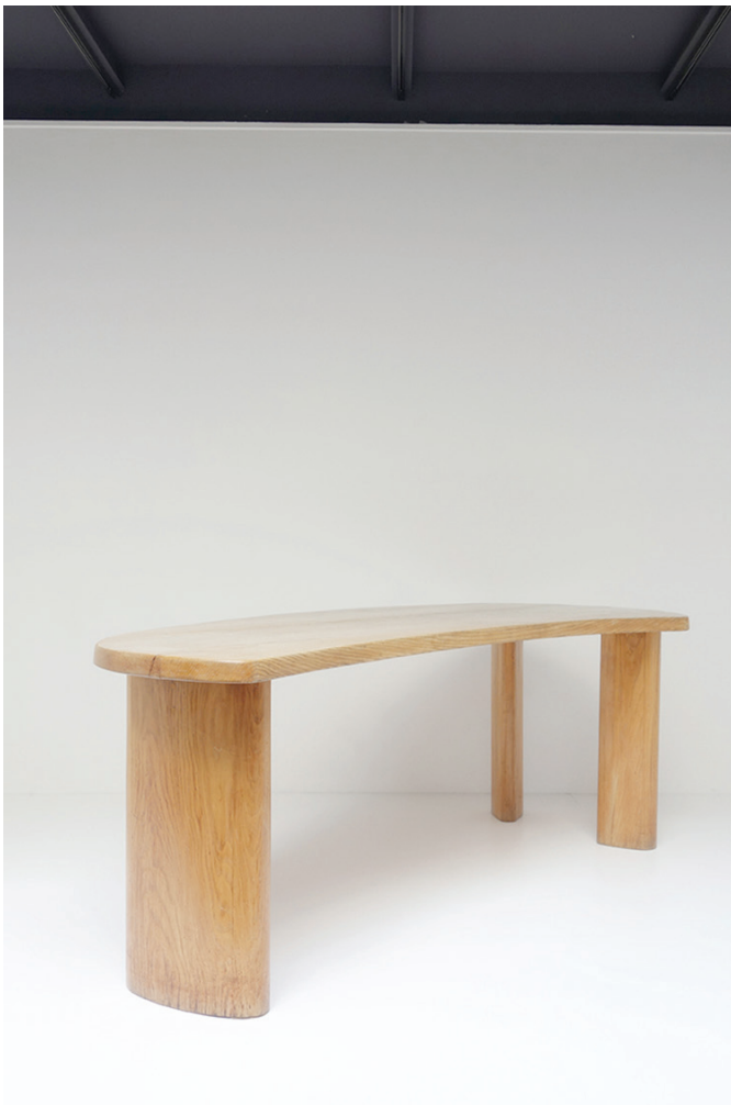
Charlotte Perriand / Pierre Jeanneret Bureau forme libre, circa 1946