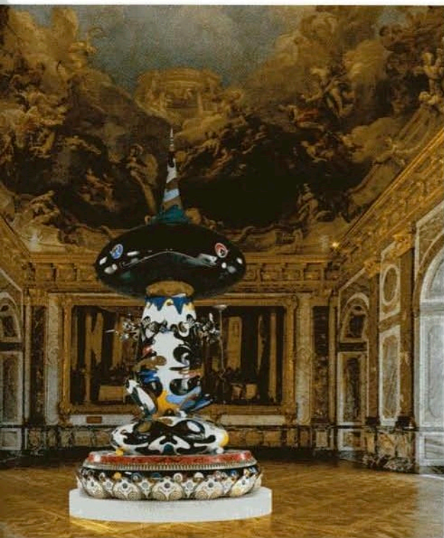
Dans le salon d'Hercule, "Tongari-Kun", 2003-2004, de Takashi Murakami.