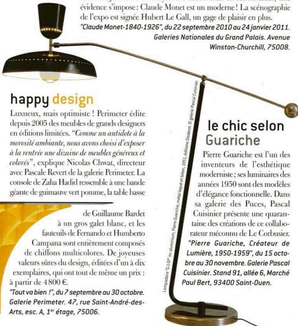
Lampadaire "G-1,SP" en aluminium, Pierre Guariche, métal laqué et laiton, 1951, éditions Disiderot.