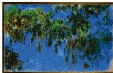
"Clujines", 1912-1920, huile sur toile de Claude Monet.

"Claude Monet-1840-1926", du 22 septembre 2010 au 24 janvier 2011. Galeries Nationales du Grand Palais. Avenue Winston-Churchill, 75008.