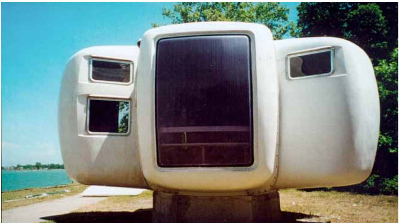
Galerie Jousse Entreprise, Biennale de l'Architecture, Venise, 2000.

Une calotte hémisphérique couronne l'ensemble. Les coques sont réalisées en polyester armé avec méthacrylate. Après le sauvetage et le montage d'éléments d'architecture de Jean Prouvé d'une part, et largement aidé par les recherches de Jean-Philippe Mercier d'autre part, la sauvegarde des maisons du village de vacances de Gripp de Jean Maneval s'est imposé comme une évidence. Des «unités d'urgence» de Jean Prouvé aux maisons bulles six coques de Jean Maneval, toutes deux comme un fait exprès, d'une surface idéale de 36 m 2 , il y a une continuité de processus qui s'impose à nous. De la maison démontable de Prouvé aux maisons mobiles de Maneval, il y a au delà du stricte style, une unité de geste, d'intention et de projet.