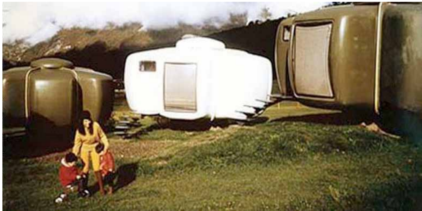
Ci-dessus: Publicité, Village de vacances de Gripp, 1969.