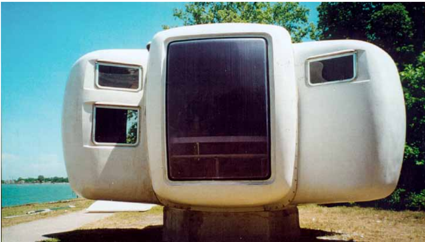
Galerie Jousse Entreprise, Biennale de l'Architecture, Venise, 2000.