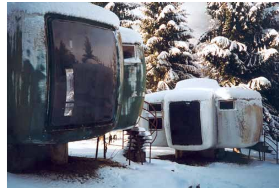
Ci-dessus ( gauche et droite) : Village de vacances Gripp, le village plastique, archives de Maneval.