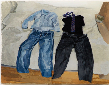
Both Ways, 2025 Gouache sur papier marouflé sur bois

© Marion Chaillou Courtesy de l'artiste et de la galerie Jousse Entreprise, Paris