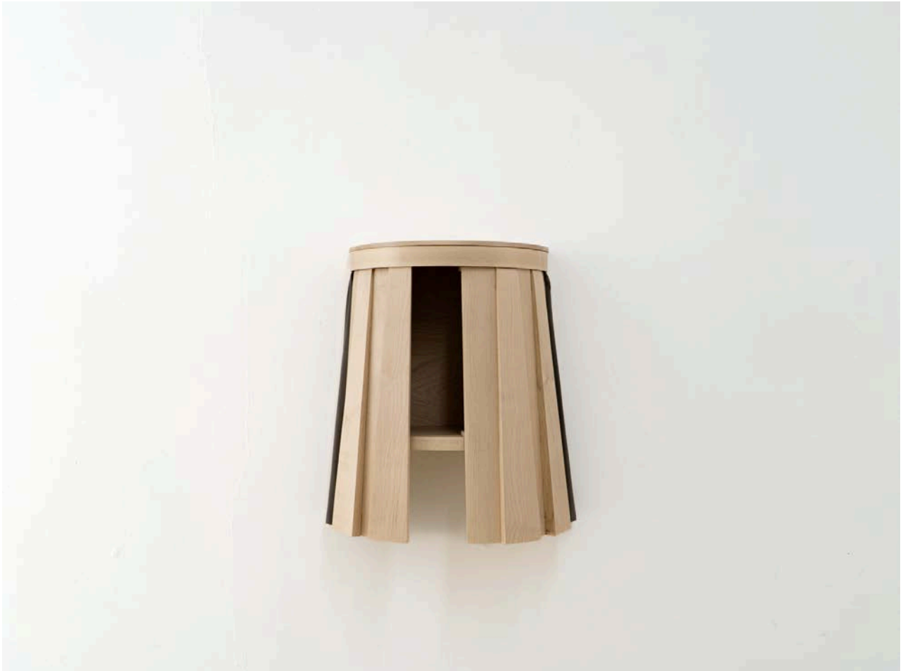
Baby doll #2, 2025 Érable, vernis, tissu

© Marion Chaillou Courtesy de l'artiste et de la galerie Jousse Entreprise, Paris