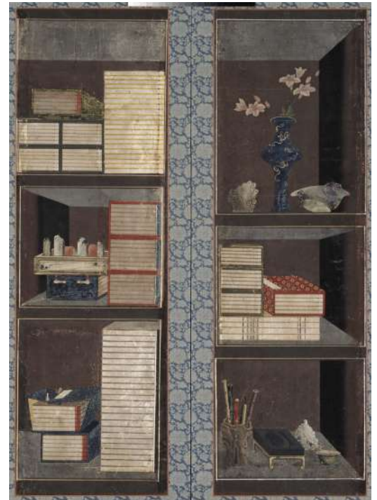
Paravent à six panneaux (détail), dynastie Yi ou Choson (1392-1910), Ancienne collection Lee U Fan, Paris, Guimet - musée national des arts asiatiques

Exposition 16 septembre 2026 – 4 janvier 2027