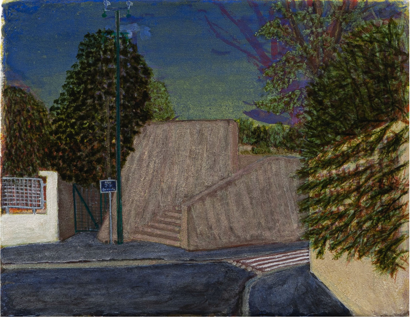
Nathan Bertet, Sans Titre (Rousseau) , 2024, oil and pigments on canvas, 14 x 18 cm

opening Saturday, November 23rd | 4pm - 9pm