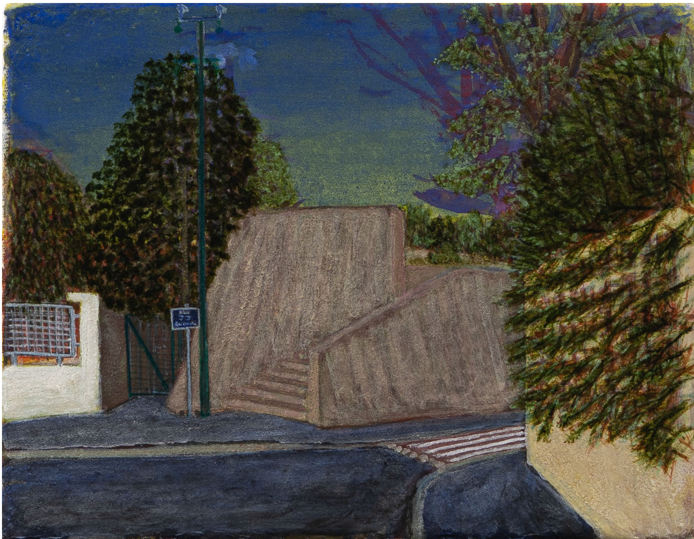
Nathan Bertet, Sans Titre (Rousseau) , 2024, huile et pigments sur toile, 14 x 18 cm

exposition personnelle du 23.11.24 au 11.01.25* vernissage samedi 23 novembre | 16h - 21h