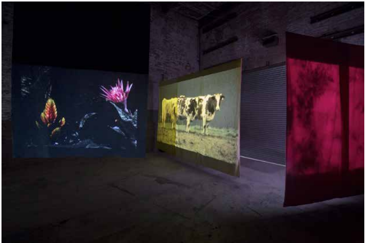
JACKLIGHTING (2020) THE CHIMNEY, NY