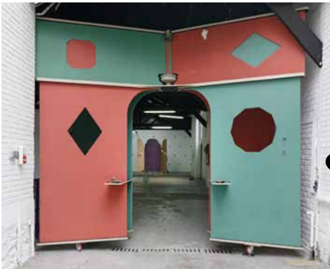
MATÉRIAU THEQUE (2019) INSTANTS CHAVIRÉS