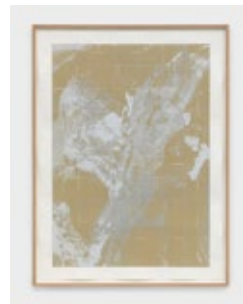
Jennifer Caubet Cairn#5 , 2018