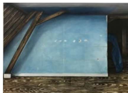
Nathanaëlle Herbelin Cerulean , 2018