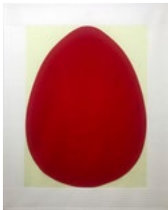
Seulgi Lee, U: Une multitude de grains de sésame tombe , 2017