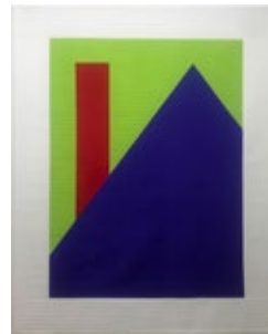
Seulgi Lee U: Il n'y a pas de fumée à la cheminée sans feu , 2017