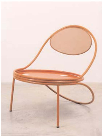
Mathieu Mategot, "Copacabana" seat,1955 (28.3x 22.4x 27.9 inch)