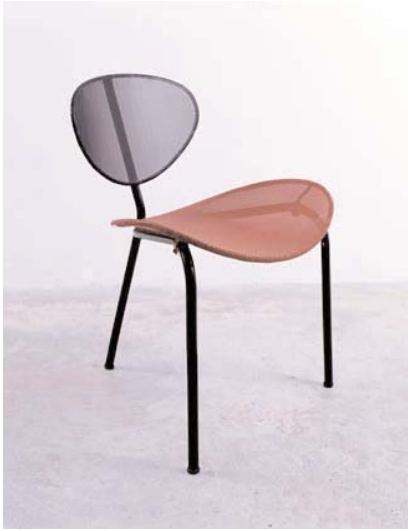
Mathieu Mategot, "Nagasaki " seat,1954 (22x 23.6x 27.9 inch)