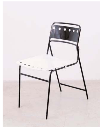
Mathieu Mategot, "Panama" chair,1953 (28.7x 15.7x 22.6 inch)