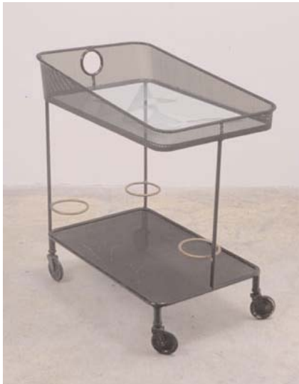
Mathieu Mategot, "Venise" service table, 1956 (27.5x 24x 15.7 inch)