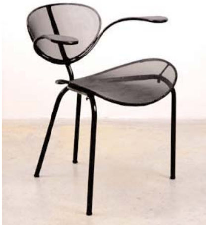
Mathieu Mategot, "Nagasaki" seat,1954 (29.9x 18.7x 26.2 inch)