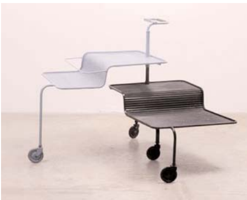
Mathieu Mategot, "Orientable" trolley, 1954 (31.4x 19.2x 28.5 inch)