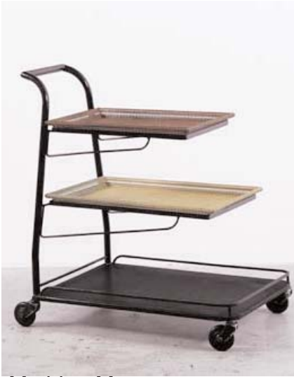
Mathieu Mategot, "Demon-table" trolley, 1951 (25.9x 29.5x 17.7 inch)