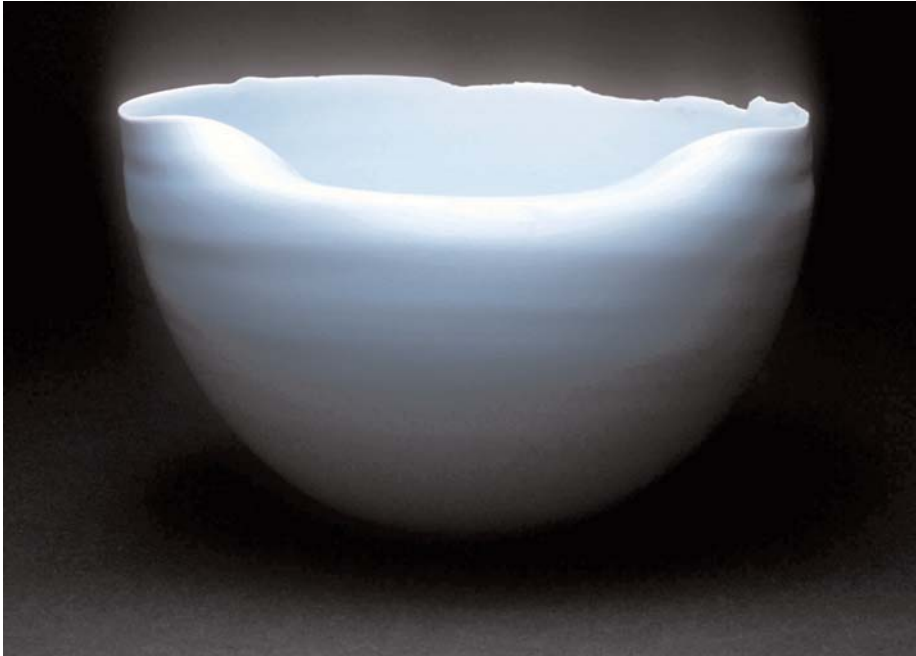
Emmanuel Boos Coupe lèvres tombante, 2004 Porcelaine blanche, émail bleu glaciale 23 x 15 cm