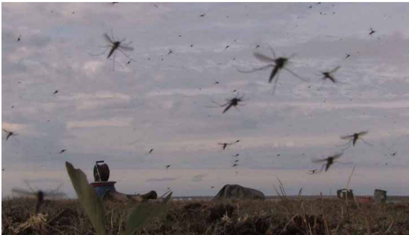
3 projections vidéo HD, sonores installation, 2009

Les visiteurs passent ensuite par un bureau de camping proposé par l'artiste à l'équipe de la galerie.