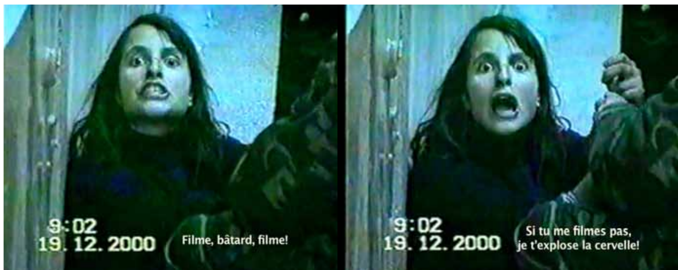
Prison - TV

Regarder l'image de quelqu'un qui nous est étranger implique toujours, à un certain degré, la mise à nu, la projection, l'investissement affectif et les rapports de pouvoir. Se trouver dans l'image signifie en revanche être confrontés à ce regard qui nous façonne et qui nous transforme en quelque chose qui ressemble à un objet. Les propriétés réifiantes et indicielles de l'appareil technique jouent un rôle crucial dans cette dynamique du pouvoir. Depuis les origines de la photographie et du cinéma, le corps a été l'un des sujets de prédilection des images documentaires, particulièrement lorsqu'il s'agissait de montrer les Autres. Le spectacle de l'altérité s'affirme à un moment historique marqué par la naissance des techniques de l'image, quand la rencontre avec la différence culturelle prend la forme de l'exposition de corps mis à nu, prétendument « authentiques », non contaminés par le contact avec la modernité. En se référant à la représentation du sujet indigène, Rey Chow a argumenté que la représentation de l'Autre surgit certes d'un acte de violence, mais qu'au lieu de penser l'image simplement comme le lieu de l'agressé, il est possible de la réinvestir à partir de ses ambivalences, en ce qu'elle laisse des possibilités ouvertes pour l'interprétation, le déplacement et la subversion 1 .