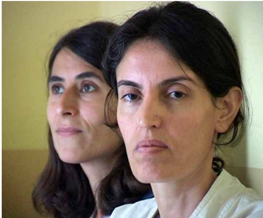
Grévistes de la faim

Mais cette proximité met en évidence aussi la fonction de ce type d'image-document comme une représentation de la réalité qui vise la production de la peur. Comme l'indique Brian Massumi, se référant aux politiques sécuritaires de l'après-11 septembre, la télévision est un moyen de la modulation affective en temps réel, elle est désormais « le médium de l'évènement 3 ». Dans cette transformation de la réalité en événement, la fonction de l'image documentaire réside dans son pouvoir émotionnel, qui produit une intensification de la